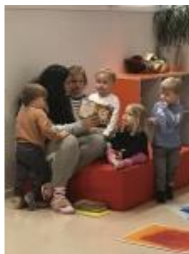
Bilde: Lesestund på avd. Ludvig.