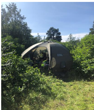
Bilde: Tilrettelegging for søvn på tur

Annen viktig informasjon: Nysgjerrighet og interessere for å lære. Håndtering av utfordringer og nye oppgavetyper. Konsentrasjonsevne, utholdenhet, oppmerksomhet (hvor lenge?). Gleder / gruer seg til skolestart (evt. årsaker). Blyantgrep.