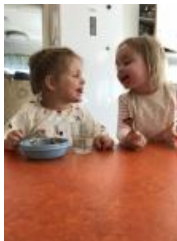
Bilde: Vi er opptatt av gode relasjoner, også ved matbordet.