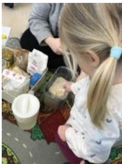
Bilde: Med god hjelp fra barna, lager vi hjemmelaget, ferskt brød.